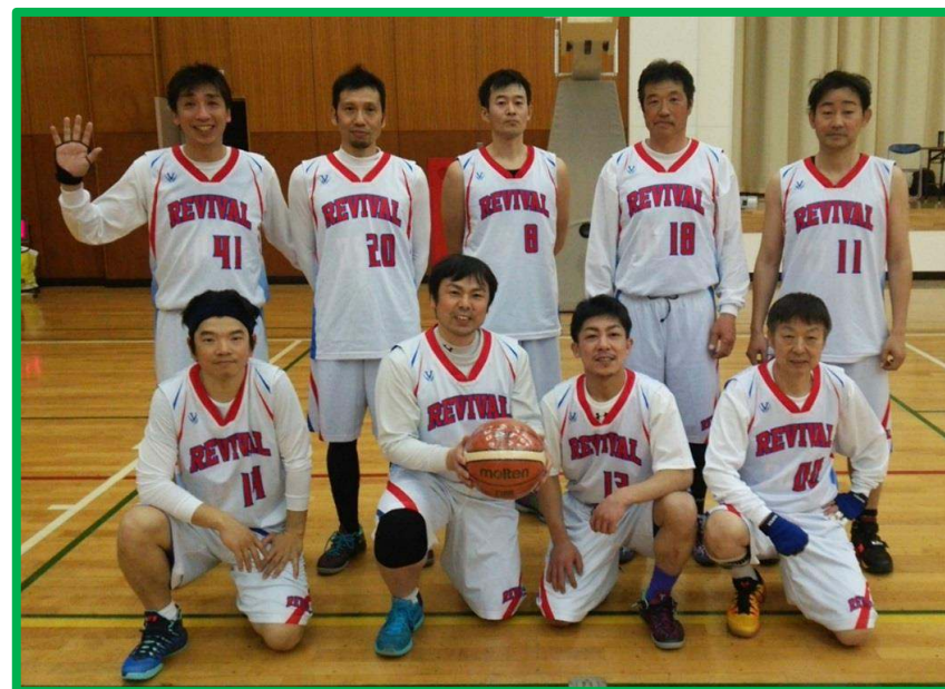
シニア優勝 リバイバル