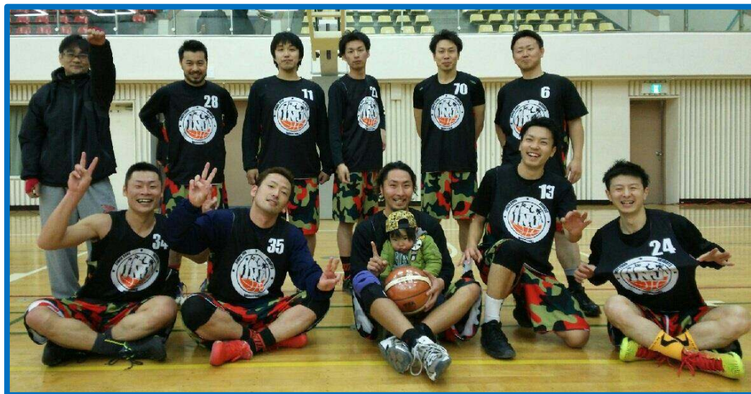
男子A優勝 インジャリーズ