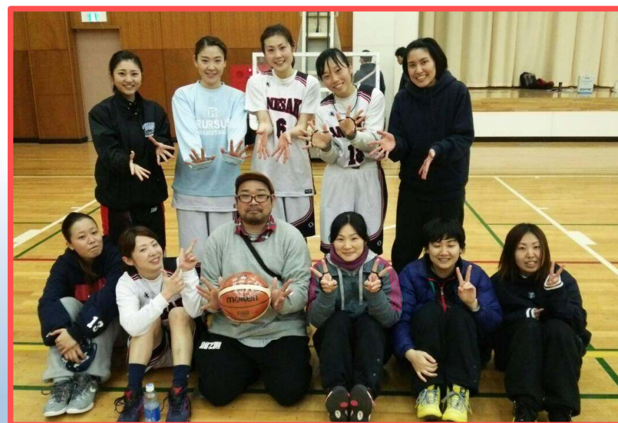
女子優勝 姉崎クラブ